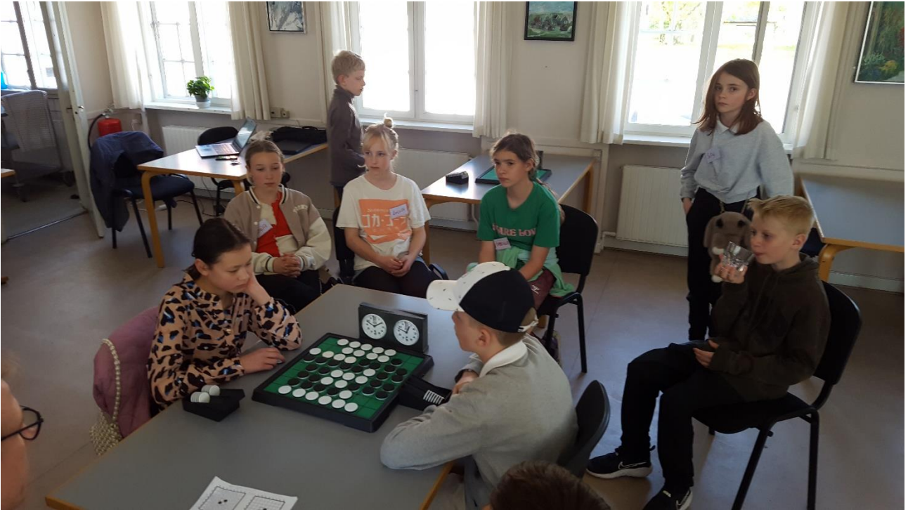
Danish Junior Nationals Classement après la ronde 8